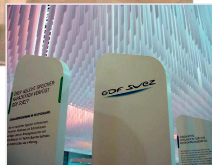
Entwurfsverfasser: aPLEX GmbH, Berlin